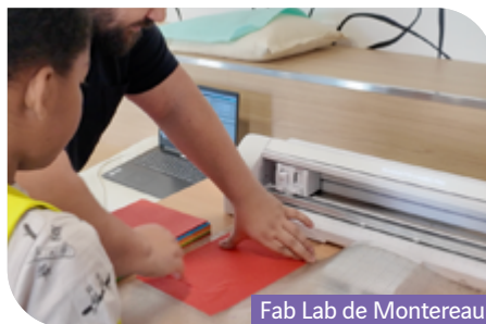
Fab Lab de Montereau

La « SAP » accueille les 6/9 ans et les 10/12 ans, du lundi au vendredi, de 9h à 12h15 et de 14h à 17h15, du 7 juillet au 29 août , dans les locaux de la Maison Pour Tous (pendant les vacances scolaires).