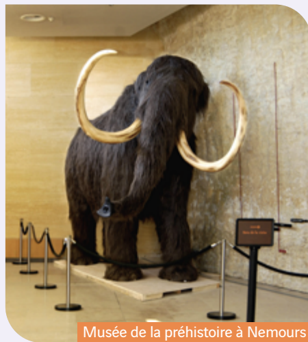
Musée de la préhistoire à Nemours

Chaque semaine proposera une approche ludique mêlant découvertes, expériences, et éveil à la culture et aux sciences.