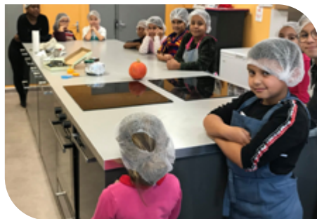
La Cité des Enfants