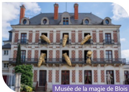
Musée de la magie de Blois