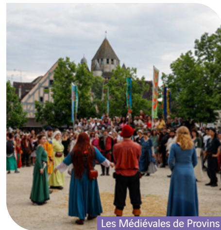
Les Médiévales de Provins