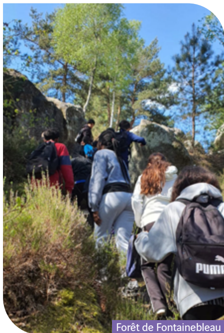
Forêt de Fontainebleau