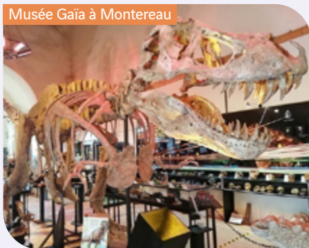
Musée Gaïa à Montereau