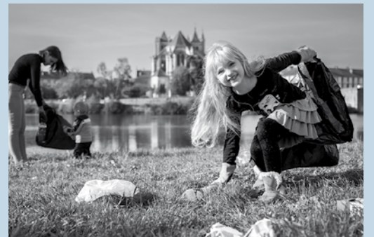
Ci-dessus la photo lauréate du concours «Montereau, responsables et engagés». Elle est l'œuvre de Jordan Fregona qui, à travers ce cliché, a souhaité montrer que des petits gestes du quotidien peuvent améliorer le confort des habitants et qu'il est possible d'apprendre cela aux générations futures.

J'ai besoin de vous ! Signez la pétition sur www.montereau77.fr et dans les accueils municipaux : notre territoire doit se faire entendre !