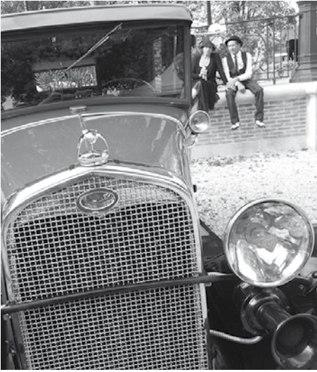
voiture Simone ! DIMANCHE 16 OCTOBRE (8H30-18H30) Parc des Noues Entrée gratuite Restauration et buvette sur place

Plus de 400 bolides vous attendent : véhicules de collection, sportifs, de prestige ou encore motos et tracteurs, chacun son style et son époque. Dès 10h, les moteurs rugiront, en partance pour une parade champêtre de 45 km. Le retour au Parc des Noues vers midi permettra à tous les visiteurs d'admirer ces bijoux mécaniques. Par ailleurs, une bourse de pièces détachées devrait ravir les plus bricoleurs. Et pour mettre l'ambiance, des musiciens de jazz assureront le show de 12h30 à 14h30. En