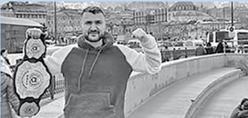
Le 19 mars dernier, le champion monterelais de Muay Thai a remporté à Istanbul le titre de Champion européen de kick boxing - 70kg. Bravo et merci de porter haut les couleurs de Montereau !

SOIRÉE ZEN : INSCRIVEZ-VOUS ! À la faveur de cette soirée Zen, vous allez pouvoir vous concentrer sur l'essentiel, c'est-à-dire vous ! Au programme : relaxation sur un coussin ergonomique, séances de yoga, massages... le tout dans une ambiance tamisée avec une musique relaxante et une eau à 33 degrés pour le petit bassin, 30 degrés dans le grand bassin. VENDREDI 22 AVRIL (18H-23H) Piscine municipale - Soirée ouverte aux + de 18 ans Tarif : 15 euros - Inscriptions sur place jusqu'au 17 avril Plus d'infos : 01 60 57 08 99