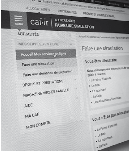
PLUS D'INFOS : caf.fr

En raison des dernières restrictions sanitaires, la CAF de Seine-et-Marne a adapté son offre de contact afin d'éviter des déplacements aux usagers et ainsi limiter les risques de contamination au Covid-19. Les professionnels de la CAF peuvent désormais être joints par les canaux suivants : > le site caf.fr ou l'application «CAF Mon compte» pour toutes les démarches en ligne > la plateforme téléphonique au 3230 (coût d'un appel local) > des rendez-vous téléphoniques peuvent également être pris sur le site caf.fr ou sur les bornes extérieures de la Maison des Services Publics. Enfin, si nécessaire, la CAF pourra également proposer un rendez-vous en accueil physique.