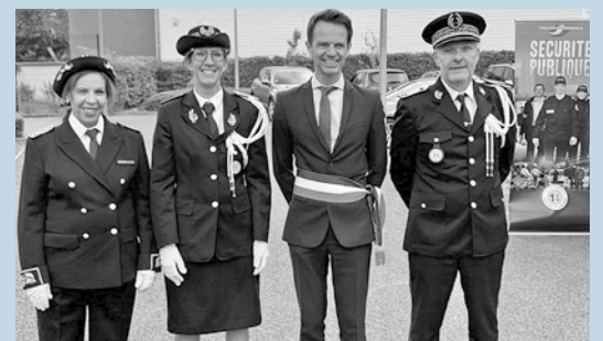
Installation de la commissaire Geai à la tête du commissariat de Montereau en présence de Madame la Sous-Préfète de Provins et de Monsieur le Directeur Départemental de la Sécurité Publique.