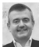
Yves Jégo Minorité municipale