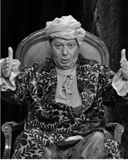
VENDREDI 5 AVRIL À 20H30 Auditorium du Conservatoire - Tarif : 5 euros Infos-résas service culturel : 01 64 70 44 14