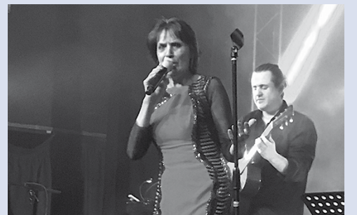
Vendredi soir, la chanteuse au grand cœur Linda de Suza a livré une très belle prestation dans une Salle Rustic comble !