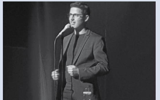
Vendredi dernier, l'humoriste Haroun s'est produit devant une salle Rustic comble. Standing ovation à la fin du spectacle !