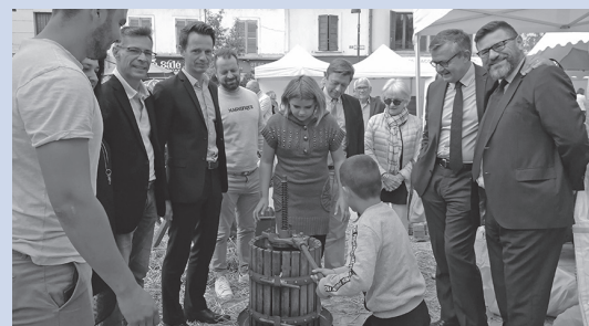
Samedi dernier sur la Place du Marché au blé, la Fête de la Pomme a connu un nouveau succès.