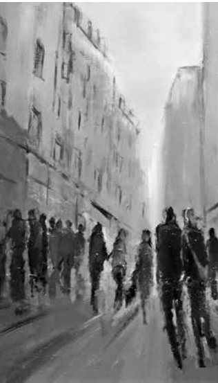
DU 7 AU 15 AVRIL Salle Sémisoroff - entrée libre Plus d’infos : 01 64 70 38 95

Amalgame est une association de faiseurs. Un ensemble d’artistes, tous mus dans la volonté de créer. Bien différents les uns des autres, mais avec en commun l’envie de trouver de l’or au fond de soi, et de l’offrir en pépite aux amateurs d’art. Avec des outils et des matières distinctes, peintres et sculpteurs créent au gré de leur inspiration. Chacun suit sa voie et parfois, pour son plus grand plaisir, vient partager des instants avec les autres artistes du groupe. Et pour le visiteur qui porte ses pas vers lui, les chemins se croisent, s’unissent, s’amalgament en œuvre à emporter en mémoire, ou chez soi, pour les plus passionnés.