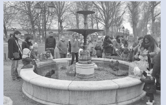
Dimanche, la traditionnelle chasse aux œufs organisée par la Ville a rassemblé de nombreuses familles monterelaises dans l'aire de jeux du Parc des Noues.

C'est pourquoi je soutiens la proposition de notre député Yves Jégo pour que le droit de réquisition s'applique au service public du transport, dans le respect du droit constitutionnel de grève mais afin de permettre un service minimum et donc de garantir des trains sur chaque ligne et dans chaque gare.