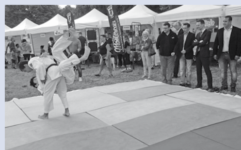
Samedi 2 septembre, démonstration de judo à l'occasion de la fête du sport et des associations.