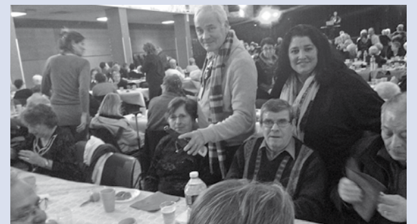
Mardi et mercredi derniers à la Salle Rustic, plus de 400 séniors ont partagé la galette des boulangers de Montereau offerte par la Ville.