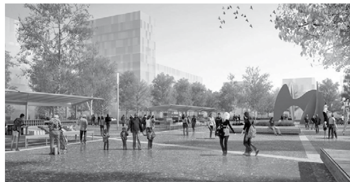
Le quartier dans quelques années !