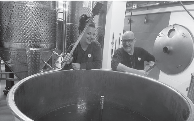
DIMANCHE 13 OCTOBRE À 16H Prieuré Saint-Martin Tarif unique : 5 euros