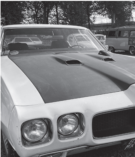
DIMANCHE 13 OCTOBRE (8H30-18H30) Parc des Noues Entrée gratuite Restauration et buvette sur place