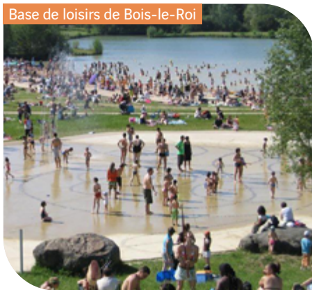
Base de loisirs de Bois-le-Roi

Ateliers créatifs autour des quatre éléments, expériences scientifiques, défis nature, quiz et jeux coopératifs, créations artistiques, constructions de cabanes, veillées à l'Accueil de Loisirs, grands jeux collectifs en extérieur et parcours d'orientation en Forêt de Fontainebleau. Tous les vendredis après-midi : grands jeux autour de la thématique de l'été suivis d'un goûter confectionné par les enfants.