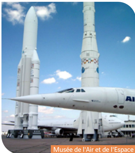
Musée de l'Air et de l'Espace

Parc du Moulin à Tan (Sens), Forêt de Fontainebleau, Cité des Sciences et de l'Industrie, Palais de la Découverte, Musée de l'Air et de l'Espace (Le Bourget), Musée de Préhistoire (Nemours) Parc des Félines, Aquarium Sea Life, et balades à Paris en bateaux-mouches, spectacle nocturne son et lumières du Château de Saint-Fargeau, Laser Game Evolution et Cinéma Confluences, bases de loisirs de Buthiers, de Bois-le-Roi et d'Étampes, nuitées à l'Accueil de Loisirs.