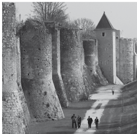
Château des Amendes 4, rue Pierre Brossolette contactbelage@ville-montereau77.fr Tél. 01 74 80 70 26