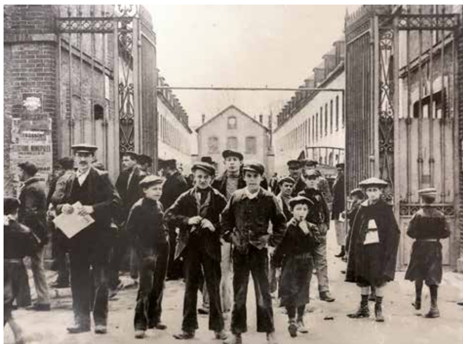
... Sortie d'une usine de faïence à Montereau au début du XX èmes .

Déclin. Cependant, le dépérissement des faïenceries dans les années 1950 marque un tournant. Celle de Montereau ferme en 1955, victime des nouveaux matériaux et des transformations de la société. Cette fermeture laisse derrière elle une empreinte indélébile sur la ville. En 1985, le Musée municipal de la Faïence ouvre au public, dans les locaux de l'ancienne poste, à deux pas de la Collégiale. Ce musée avait pour vocation de préserver et d'exposer le riche héritage de la faïence locale. Il présentait une collection permanente, témoignant des deux siècles de production de faïences à Montereau. Malgré son riche contenu, le musée a fini par ne plus