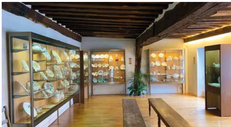
... L'ancien Musée de la Faïence, Place René Cassin