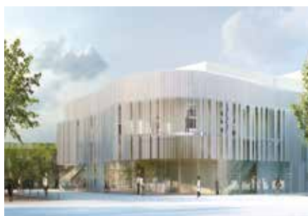
••• Le Grand Théâtre de Montereau sera non seulement un lieu de production culturelle mais aussi un moteur pour l'économie et la dynamique du centre-ville.

des Amendes, d'aménager un Pôle Médical Municipal et un pôle sécurité dans les locaux de l'ancienne trésorerie, de transformer la salle Rustic en marché couvert et de rénover la place Jean-Paul II (parvis de la collégiale). Un soin particulier sera apporté à l'amélioration de la qualité des logements, notamment en réhabilitant les bâtiments les plus dégradés dans le cadre d'une OPAH-RU. Le stationnement gratuit sera préservé dans l'hypercentre (où il est limité dans le temps), avec le récent déploiement de bornes de contrôle. Le wifi gratuit sera prochainement déployé en ville.