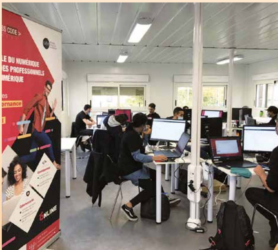
... L'école du Web de Montereau qui forme aux métiers du numérique les plus porteurs a ouvert ses portes le 9 octobre.

Garantir une ville hospitalière, celle où chacun a sereinement et justement sa place. En développant le micro-crédit personnel pour concrétiser les projets de chacun, en ouvrant un espace de lutte contre les harcèlements, en réalisant un code de conduite axé sur les devoirs de politesse, en renforçant l'attractivité de Montereau avec la création d'un port fluvial de plaisance et d'une péniche-hôtel... ■