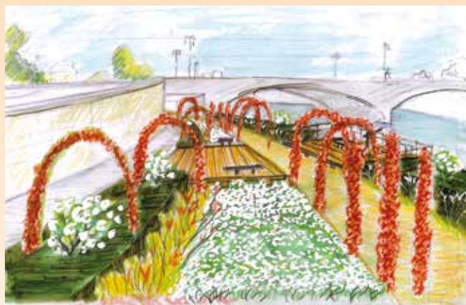
••• Aménagement des Berges de l'Yonne

et en valeur. Pour endiguer le phénomène, il faut à la fois embellir l'espace public, rénover les bâtiments à usage d'habitation et de commerce et animer le centre-ville. Pour ce faire, il est prévu de développer les équipements publics avec la construction du Grand Théâtre (2020 – 2022), d'installer la Maison du Bel Âge au Château