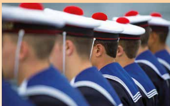
••• Des corsaires aux marins modernes, l'intrigante perpétuation de la tradition des « Cols bleus »

À l'époque des corsaires, les marins portaient les cheveux longs. Louis XIV, soucieux de l'apparence et de la sécurité de ses marins, éditait une ordonnance indiquant que les cheveux devaient être noués en une queue de cheval ou en catogan. Ces derniers enduisaient alors leurs chevelures de suif afin de ne pas les arracher dans les cordages et de les rendre plus rigides. L'inconvénient était que cette chevelure était très sale et grasse et salissait le col des vêtements. Une solution fut vite trouvée avec ce