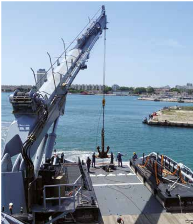
••• Manœuvres délicates effectuées en parallèle du ponton et par équipe sous-marine.