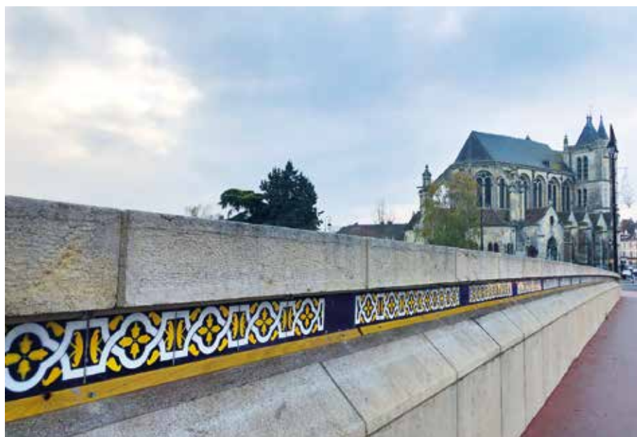
... Octobre 2020, mise en place des faïences sur les ponts de Montereau.