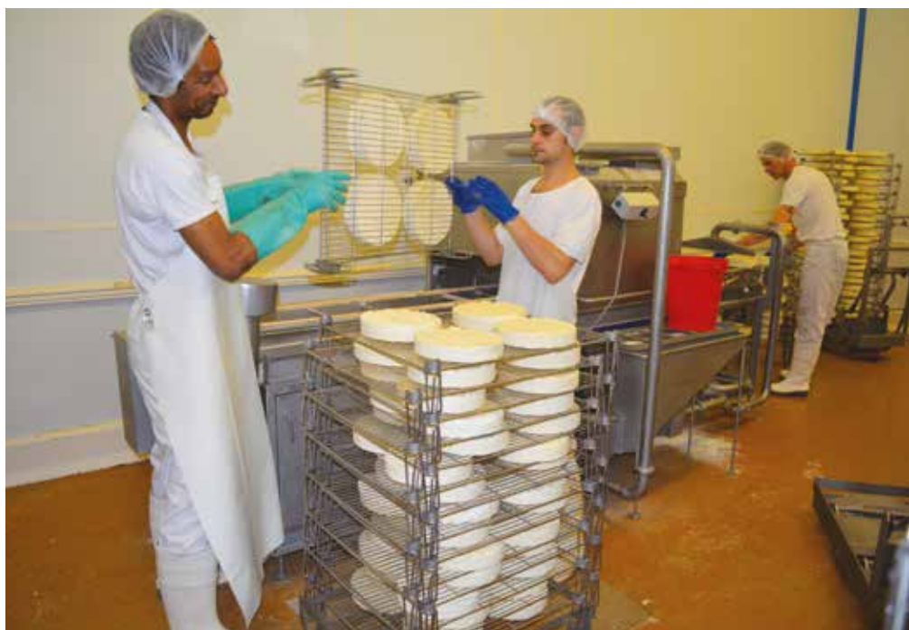
... Le Brie de Montereau en pleine fabrication dans la société fromagère de la Brie