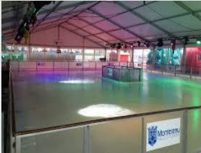
Installation de la patinoire

L'inauguration de la patinoire a été animée par un show du célèbre patineur artistique Brian Joubert.