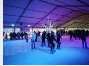
Soirée animée par un DJ