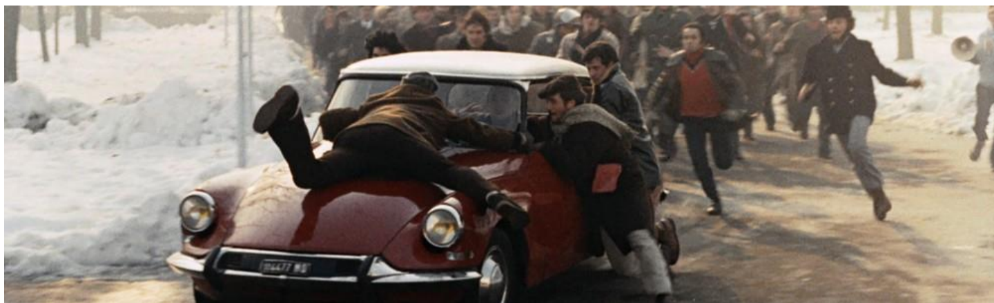
La classe ouvrière va au paradis

De janvier à juin 2025, les spectateurs du Ciné-club de Montereau sont encore venus nombreux redécouvrir en salle de grands classiques contemporains ( Le Dernier des Mohicans , Drive ), des immortels du cinéma français ( Madame de... , Pépé le Moko ) et de véritables chocs cinématographiques ( Mandingo , Requiem pour un massacre ). Cette première période constitue notre record d'entrées des trois dernières années. Merci à tous les spectateurs, fidèles ou occasionnels, pour votre enthousiasme !